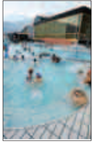
Il lido di Gardolo

Via libera della Giunta comunale al bilancio preventivo di Asis: il semaforo verde per la previsione 2012-2014 dell'Azienda per la gestione degli impianti sportivi è arrivato nella seduta del 23 luglio. Atto che segue l'approvazione - da parte del Consiglio comunale - il 19 giugno scorso, del Piano di programma 2012-2014 dell'Azienda. Che punta sempre più sul fotovoltaico: fino al 2013 (quando in base al patto di stabilità non potrà più farlo), Asis continuerà a investire nei pannelli per risparmiare energia, facendo ricorso a mutui bancari: si stima un investimento complessivo di circa 2 milioni di euro.