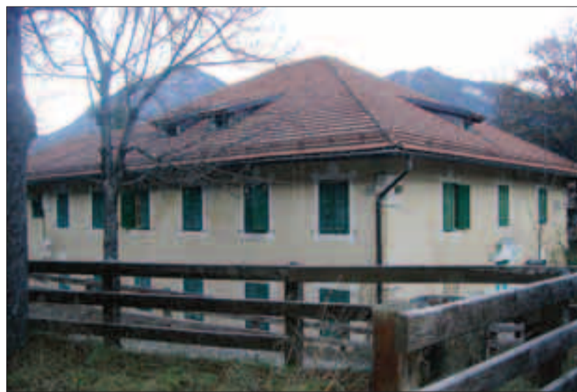
Il padiglione delle ex Colonie Milanesi che sarà destinato a centro Anffas e polo sociale

Sede dell'associazione e dei servizi sociali