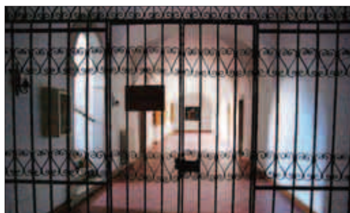
Gli interni del monastero delle Serve di Maria ad Arco. Sabato la visita

Nel monastero di clausura delle Serve di Maria ad Arco (dalle 14 alle 17, gruppi di venti persone circa, partenza ogni