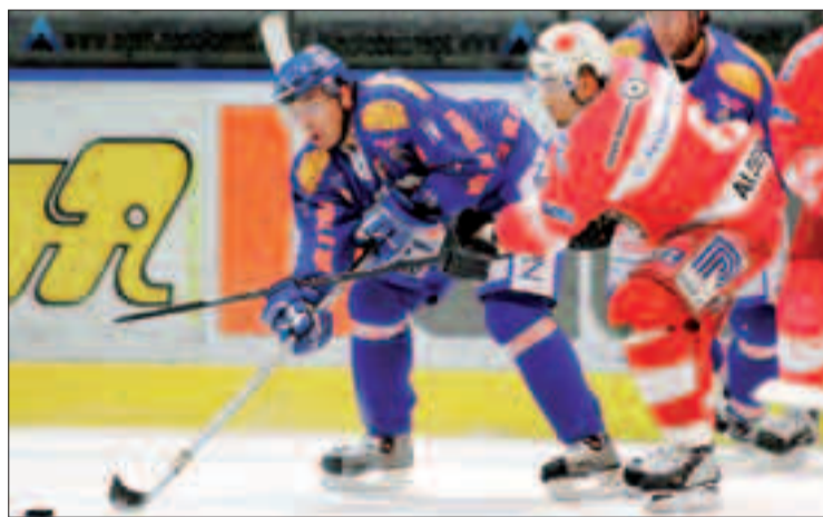
Partita di hockey su ghiaccio tra Hc Fassa e Hc Bolzano nello stadio «Scola»

CANAZEI - Arriva dalla Provincia il finanziamento dei lavori di adeguamento dello stadio del ghiaccio di Alba. La giunta provinciale ha concesso al Comune di Canazei un finanziamento complessivo in conto capitale di 969.553 euro, pari al 95% della spesa ammessa (1.020.582 euro), suddiviso in due capitoli: l'adeguamento alla normativa antincendio dello stadio del ghiaccio Gianmario Scola per 675.053 euro; i lavori di adeguamento delle strutture per 294.500 euro. Al Comune di Canazei era stato concesso il finanziamento per i lavori di adeguamento dell'impianto frigorifero dello stadio del ghiaccio, per 634.248 euro, e la Provincia aveva prorogato il termine per la presentazione della documentazione sull'adeguamento delle strutture e del manto di copertura; quest'ultimo è stato poi sostituito dall'intervento di adeguamento alla normativa antincendio, alla realizzazione di un nuovo accesso ad un edificio comunale (106.500 euro) e al rifacimento di marciapiedi e pavimentazioni tra gli abitanti di Alba e di Canazei (224.286 euro).