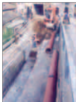
La posa di tubi fognari