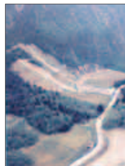
La discarica a Masi Rovigo

BORGO - In occasione della recente seduta a palazzo Ceschi, l'assemblea della Comunità di valle ha messo mano, per la prima volta, al bilancio di previsione del 2011. Una variazione complessiva, quella approvata a larga maggioranza, pari a 2.384.344 euro, di cui 891.894 euro per la manutenzione straordinaria della discarica dismessa in località Masi Rovigo a Grigno ed altri 991.211 euro per la messa a norma dell'impianto natatorio di Borgo. Poco meno di 1.900.000 euro sono assegnati dalla Provincia, che ha anche messo a disposizione 24.480 euro per finanziare il progetto «Green Governance». Altri 9.000 euro serviranno per l'elaborazione del Piano territoriale di Comunità mentre 9.759 euro sono destinati al nuovo Piano di sviluppo. Via libera anche alla sistemazione dei vari capitoli, sia in entrata che in uscita, previsti per la gestione della discarica Solizzano di Scurelle e alla modifica dell'articolo 2 del regolamento degli alloggi protetti. M. D.