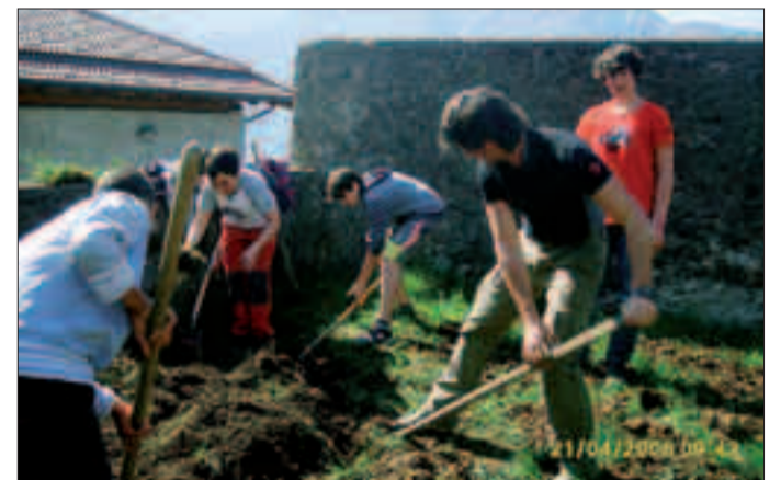
I ragazzi scoprono i segreti dell'orto al castello