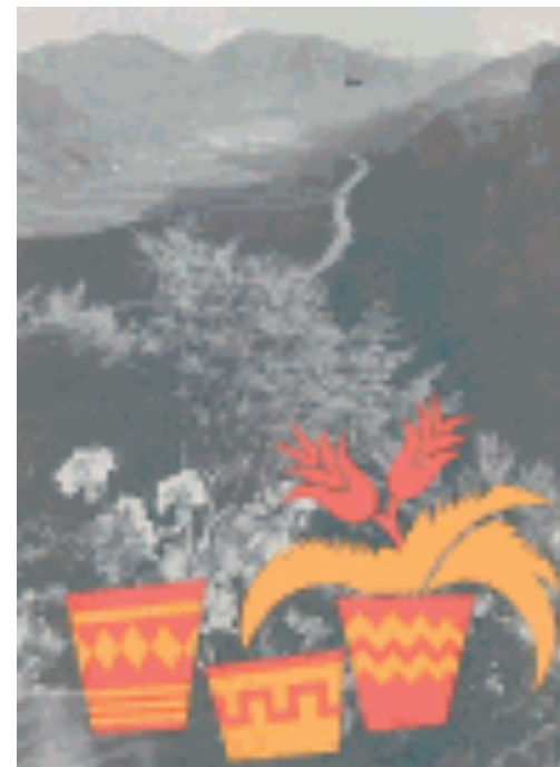
Una delle fotografie «colorate» da Depero

In allestimento fino al 21 agosto Dal 12 novembre a Bolzano, nella sede del Circolo la Stanza