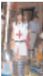
A Castel Corno di Isera

ISERA. Per gli appuntamenti del «Gioco dei castelli», questa sera alle 21.30 Castel Corno ospita «Il castello delle congiure. Spettacolo di suoni e luci». In collaborazione con il Comune di Isera, Isera srl e Biblioteca comunale. Servizio gratuito di bus con partenza da Lenzima dalle 20.30 fino al termine dello spettacolo. Ingresso libero e gratuito. (c.l.)